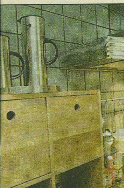
Der er ingen af i køkkenet. Til gengæld er skufferne i egetræ.