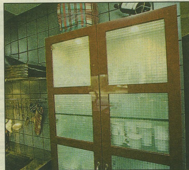
Vitrineskabet med plads til glas og porcelæn er på hjul og med kanter i bordeaux som resten af køkkenet.