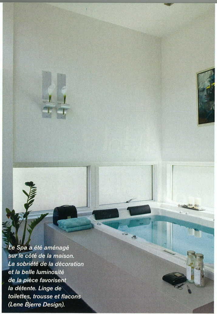
Le Spa a été aménagé sur le côté de la maison. La sobriété de la décoration et la belle luminosité de la pièce favorisent la détente. Linge de toilettes, trousse et flacons (Lene Bjerre Design).

Zen attitude dans la chambre où une fenêtre tout en longueur crée une ligne horizontale apaisante. Un store à lamelles verticales dynamise l'ensemble et protège des regards extérieurs. Linge de lit et lampe (Lene Bjerre Design).