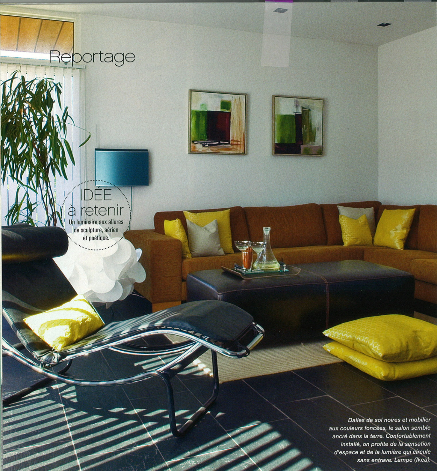
Dalles de sol noires et mobilier aux couleurs foncées, le salon semble ancré dans la terre. Confortablement installé, on profite de la sensation d'espace et de la lumière qui circule sans entrave. Lampe (Ikea).

IDÉE à retenir Un luminaire aux allures de sculpture, aérien et poétique.