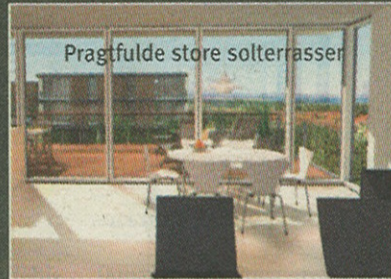
Pragfulde store solterrasser

Kør fra Vestre Allé - eller rundkørslen på Skelagervej - ad Bejsebakkevej til toppen af Hasseris, hvor projektet ligger.