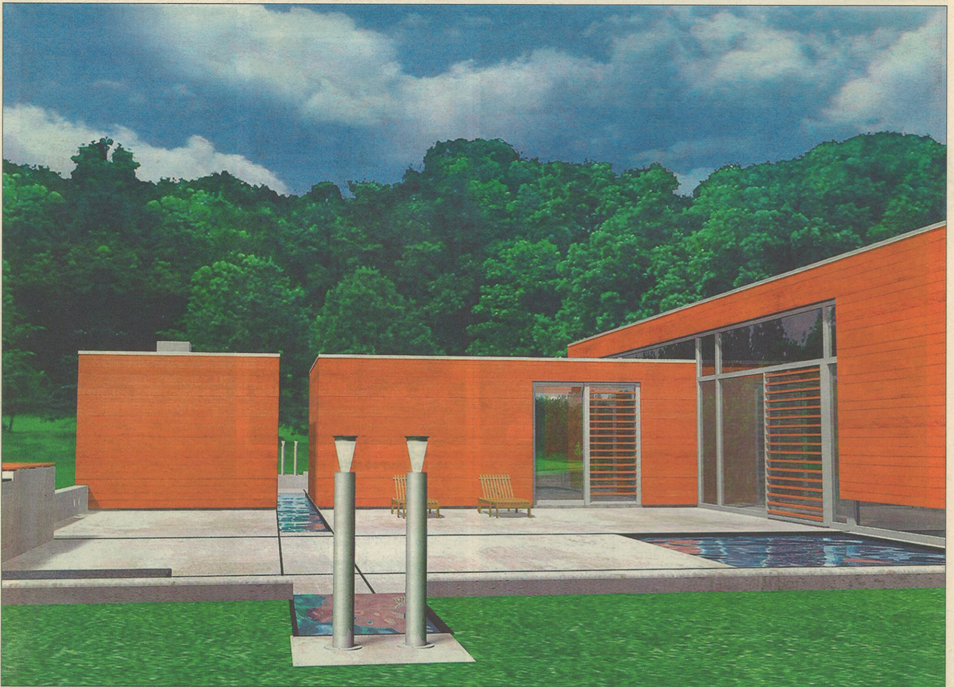
Træ, stål, glas, vand og ild er husets materialer.