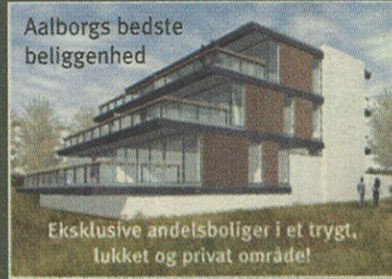
Aalborgs bedste beliggenhed

Eksklusive andelsboliger i et trykt, lukket og privat område!